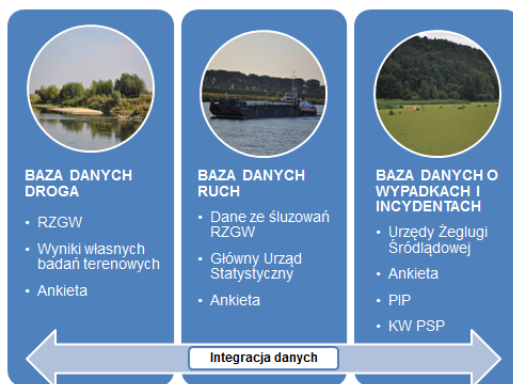
Rys. 1. Bazy danych dotyczące żeglugi śródlądowej na Dolnej Wiśle

W wyniku prowadzonych badań stworzono bazę danych integrującą dane o drodze wodnej, ruchu jednostek oraz wypadkach i incydentach (rys. 1).